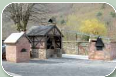
Au début des travaux

C'est un bel ouvrage qui a été édifié dans la cour de la salle des repas située Quai Quinet. Le four à pain conçu et réalisé par les services techniques de la ville a nécessité six mois de travail. A noter que ce projet a fait l'objet d'un avis positif de l'Architecte des Bâtiments de France