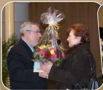
Départ en retraite