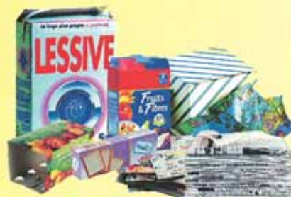
Les papiers et les cartons

Les bouteilles et flacons plastiques ainsi que les briques alimentaires peuvent être écrasés . Merci de laisser les bouchons sur les bouteilles pour qu'ils soient recyclés.