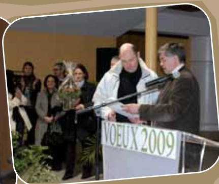
Remise de médaille du travail le 6 janvier 2009