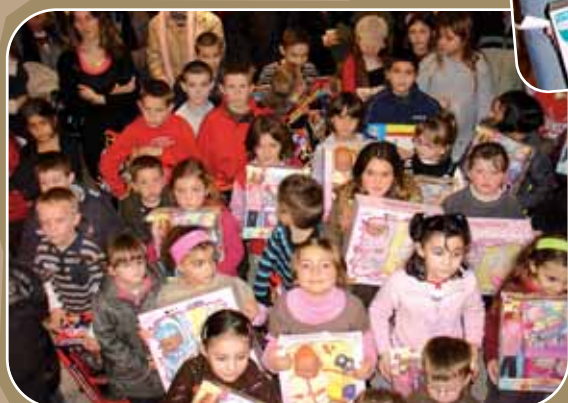
Concours des Cartes de Noël / UCAR