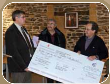
Remise du chèque à l'Association Positif 08