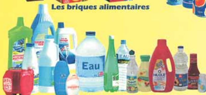
Uniquement les flaconnages plastiques (bouteilles, flacons, bidons) même les "gras" (huile, mayonnaise, ketchup, vinaigrette)