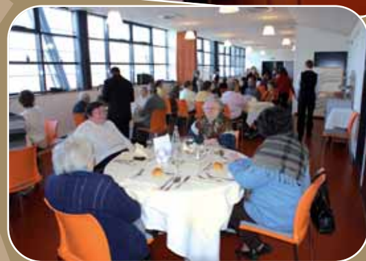
Repas des Anciens à l'Espace Lenoir le 8 janvier 2009