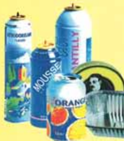
Les emballages métalliques (acier et alu)