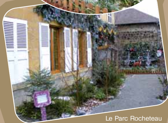
Le Parc Rocheteau décoré