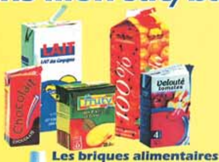
Les briques alimentaires