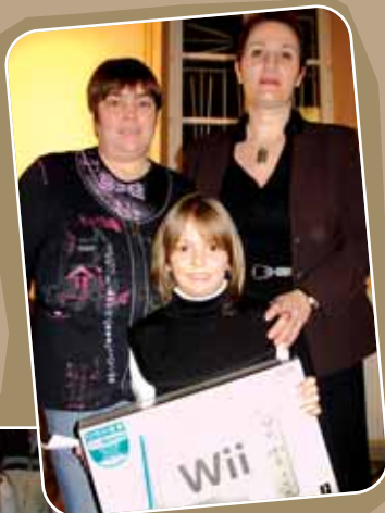
La gagnante du concours